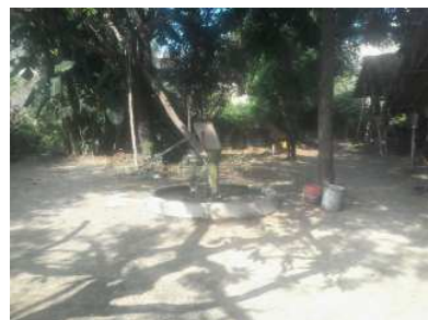
बैजनथ पुत्र बंधन के घर के सामने।