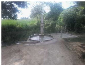
चरित्तर पुत्र सोम्मर के घर के सामने।