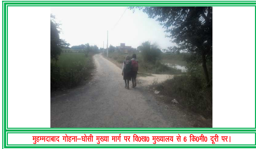
मुहम्मदाबाद गोहना-घोसी मुख्या मार्ग पर वि०ख० मुख्यालय से 6 कि०मी० दूरी पर।