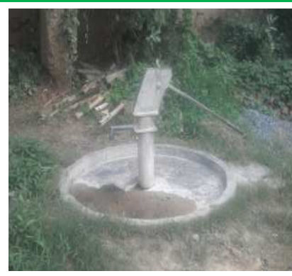
चरित्तर पुत्र सोम्मर के घर के सामने।